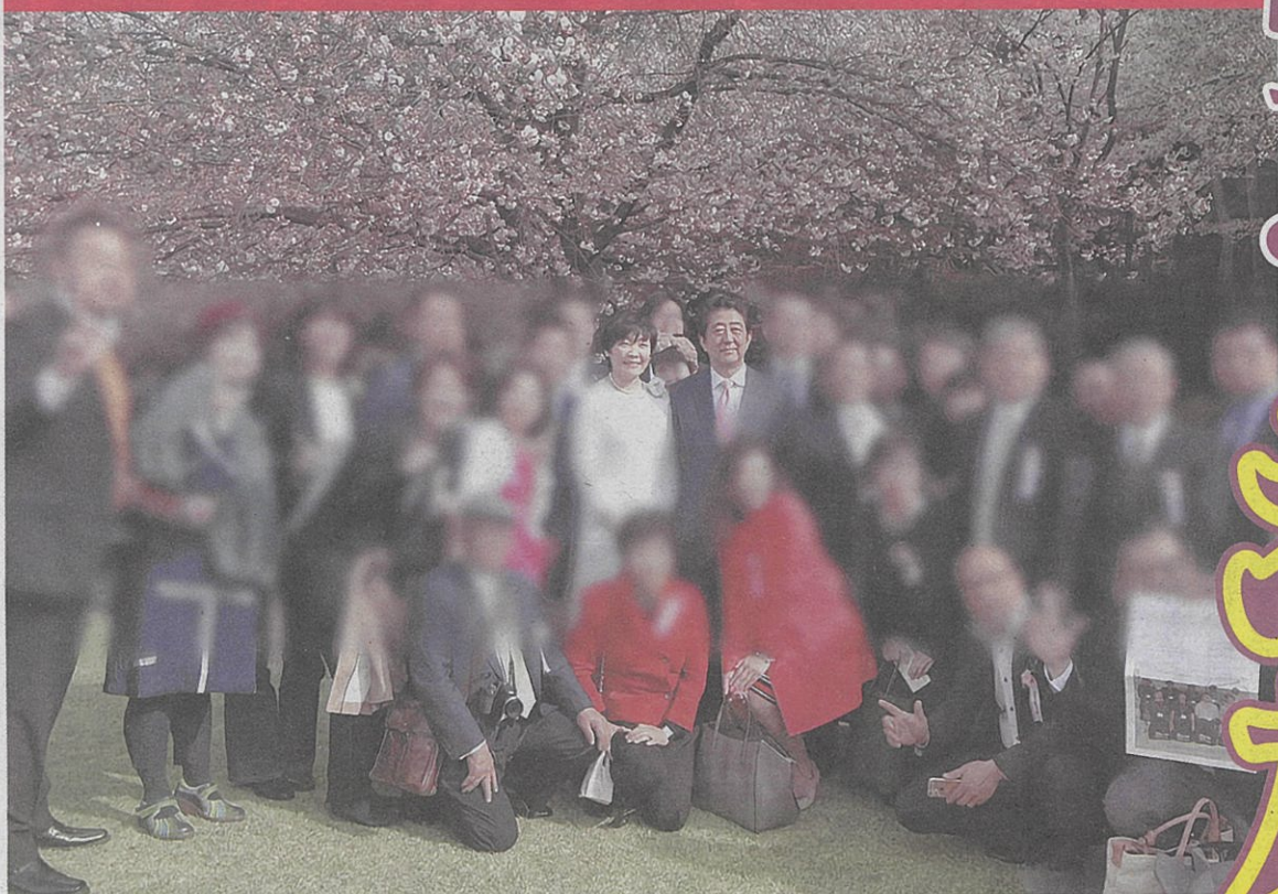
昭恵氏が名誉役員だった団体の関係者らとの集合写真。中央に昭恵氏と安倍首相(2016年4月9日付の昭恵氏フェイスブックから)