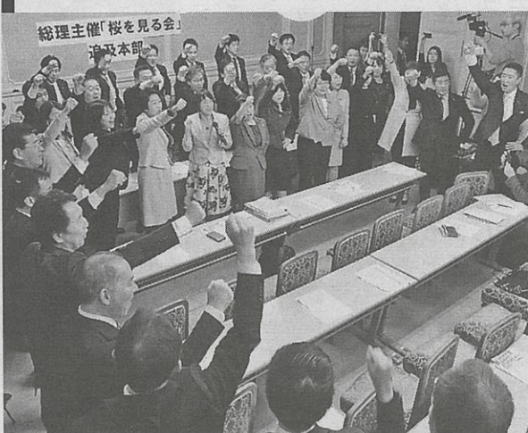
「桜を見る会」追及本部発足で徹底解明へ決意を示す野党議員＝11月25日、国会内

野党一丸となった国会追及のなかで、「疑惑は公的行事の私物化」という問題にとどまらない。安倍首相が先頭にたって、自民党ぐるみで行った政治買収の疑いが極めて濃厚」（11月25日、日本共産党の小池晃書記局長）