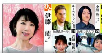
伊藤蘭さん、金子勝さん、日本共産党の議員たち

稲川淳二さん「年金制度の改善をアピールする参加者」のツイートで呼びかけられたデモで、年金制度の改善をアピールする参加者＝10日、東京・銀座