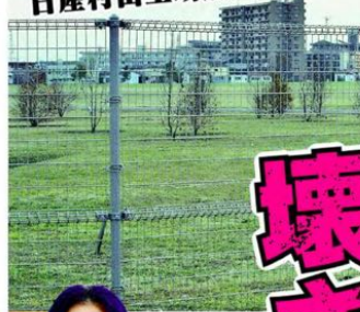
アホノミクスが第二、第三のゴーン生む