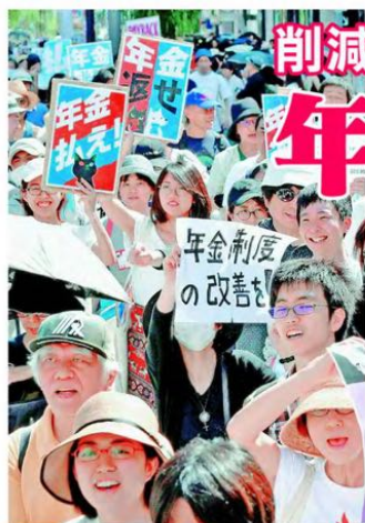
ツイッターで呼びかけられたデモで、年金制度の改善をアピールする参加者＝10日、東京・銀座