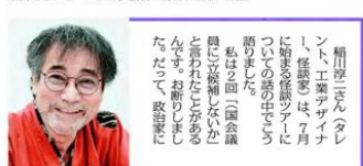
稲川淳二さんタレント